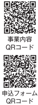
事業内容 QRコード 申込フォーム QRコード