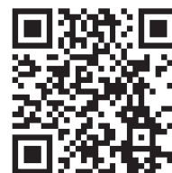
上天草ブランド 認証品一覧