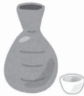
②日本酒 (15%) 1合 180ml