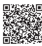
申込フォーム QRコード