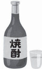
③焼酎 (25%) グラス1/2杯 (110ml)