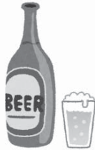
①ビール (5%) 中びん1本 500ml