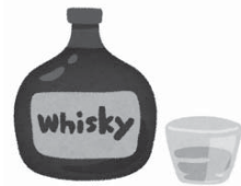
④ウイスキー (43%) ダブル1杯 60ml