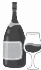
⑤ワイン (12%) グラス2杯弱 200ml