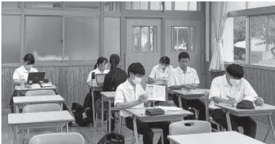
かみあま塾 授業風景

令和6年度のかみあま塾も引き続き、公務員講座などで生徒たちのサポートをさせていただきます。これからも精一杯活動していきますので、今後とも宜しくお願致します。