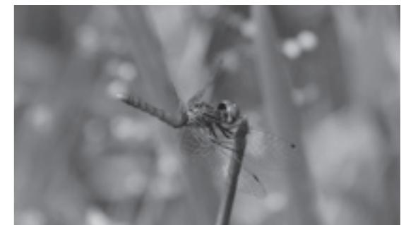
▲ハッチョウトンボ(雄)

ハッチョウトンボ("Nannophya pygmaea" トンボ科ハッチョウトンボ属)は、日本一小さなトンボとして知られ、体長は雌雄とも20mmほどで、一円玉にすっぽりと収まる程度の大きさしかありません。全国的にも減少傾向にあり、33の都府県で絶滅危惧種などに選定されています。熊本県でもかつては、広く分布していましたが、多くの場所で絶滅し、現在、上天草市の白嶽湿地が唯一の生息地となっています。ここは、他にも多くの希少な動植物が生息・生育する貴重な環境です。(自然偏担当 坂梨仁彦委員)