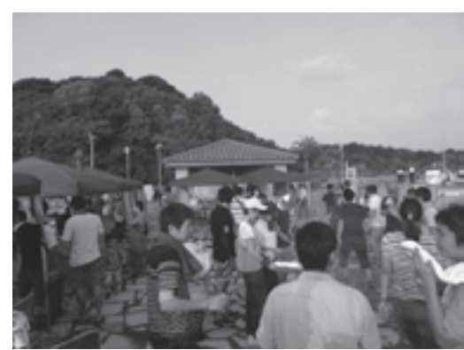
▲フィッシャリーナ天草での交流会

洋風の建物と大型クーラーが係留する、上天草市自慢のロケーションであるフィッシャリーナ天草をお借りして開催されたこのイベントには、上天草市内の誘致企業の従業員と市職員の独身の若者を中心に100名以上の方にご参加いただきました。 夕方から開催された交流会は、暑さがいくぶん和らいだ海辺の潮風を頬に感じながら、美味しいバーベキューとお酒を囲んで始まりました。 参加者は、自らが所属している業種とは違った、日ごろ接するこ