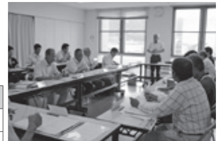
▲平成28年度第1回文化財保護委員会