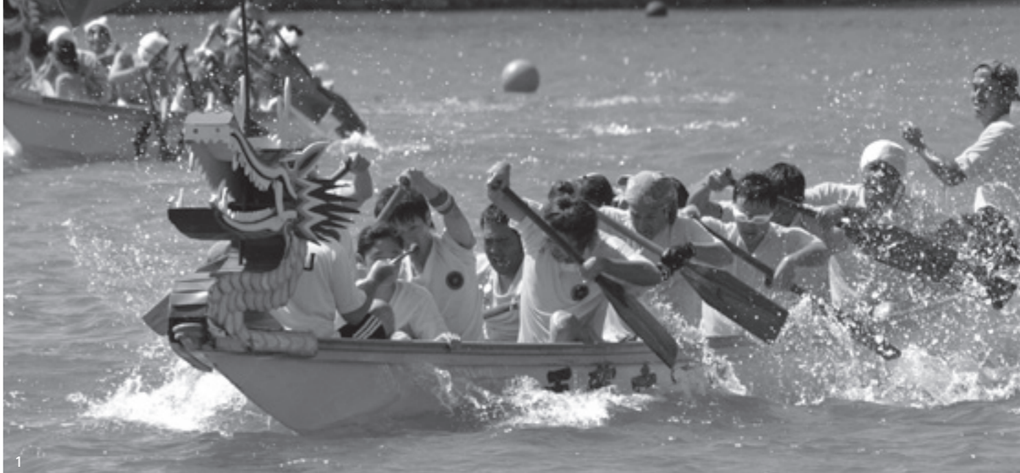
【これまでの五橋祭】 1. 迫力の白龍船競漕大会 2. カみなぎるYOSAKOI 3. 奪い合い! 魚のつかみ取り大会 4. スターのステージショー 5. 一生懸命おどりました! 道中踊り 6. きれいだわー。海洋花火大会