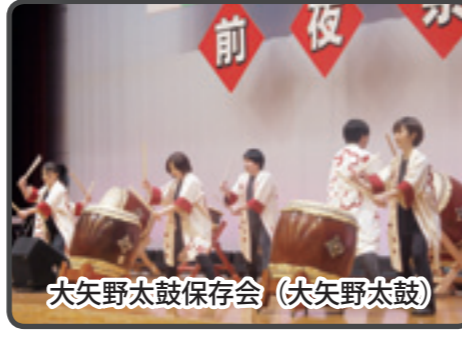
大矢野太鼓保存会 (大矢野太鼓)