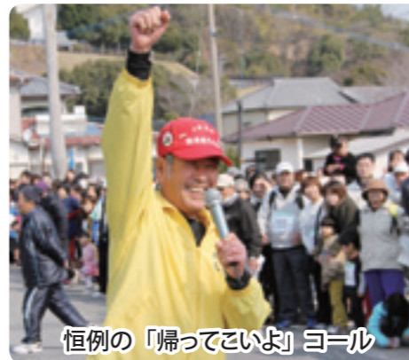
恒例の「帰ってこいよ」コール