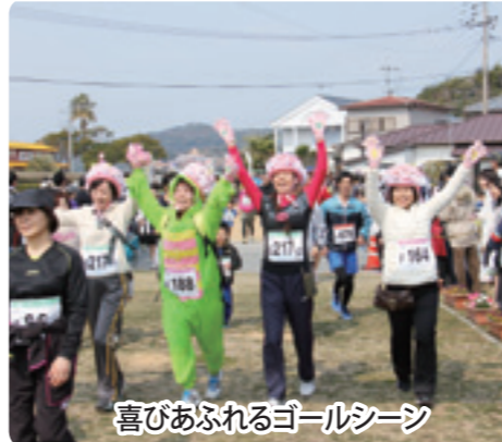
喜びあふれるゴールシーン