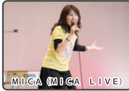
MICA (MICA LIVE)

パールラインマラソン大会の前日となる3月8日には、大矢野総合体育館で前夜祭が行われました。会場には、前日受付を済ませたランナーや地元の人々でにぎわいました。