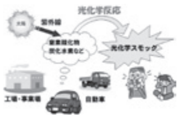
光化学スモッグ発生メカニズム

する」などの症状が現れるため、光化学オキシダントの濃度が基準を超えた場合、県から「光化学スモッグ注意報」が発令されます。注意報が発令された場合は、屋外での運動などはやめ、できるだけ早く室内に入ってください。 もし、症状が現れたら、水道水などのきれいな水で洗眼、うがいなどを十分に行い安静にしてください。それでも回復しない場合や、咳や頭