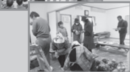
倉江川青ノリ加工作業の様子