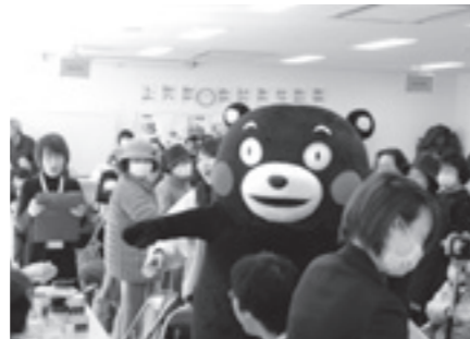
◀低カロリーメニュー紹介