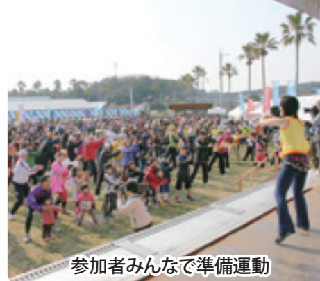
参加者みんなで準備運動