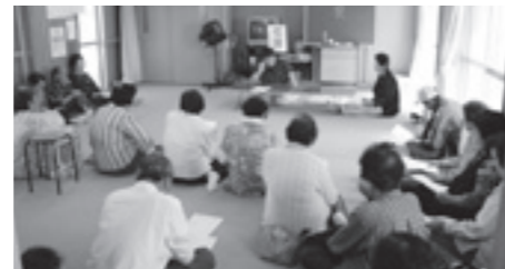
◀健康講座風景 (大道夏網代集会所)

当院では、地域の皆さまのもとへ出向き、健康づくりの取組みの一つとして出前健康講座「ふれあい健康講座」を行っています。地域住民の皆さまとふれあいながら、健康について一緒に考える機会となり、参加した人からは「ためになった」「楽しかった」「来てない人にも教えてやらんば」などの意見がありました。今後、さらに充実した講座になるよう努めていきますので、地域の皆さまの健康づくりの一環としてご利用ください。