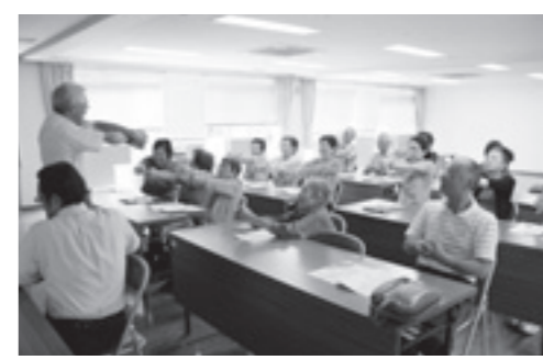
▲歌う人権講話の様子