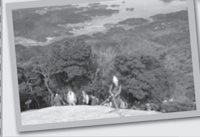
▲次郎丸嶽からの絶景