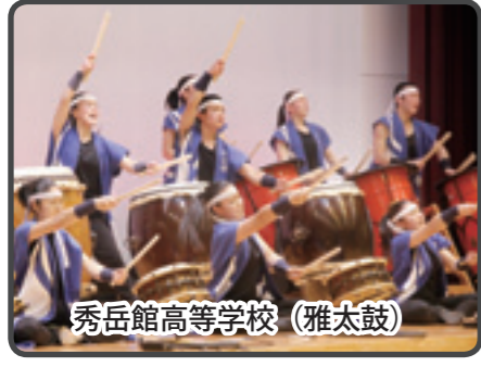
秀岳館高等学校 (雅太鼓)