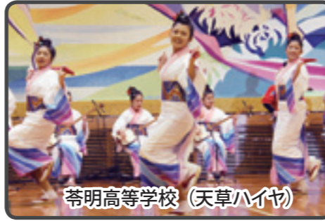
苓明高等学校 (天草ハイヤ)

パールラインマラソン大会の前日となる3月8日には、大矢野総合体育館で前夜祭が行われました。会場には、前日受付を済ませたランナーや地元の人々でにぎわいました。