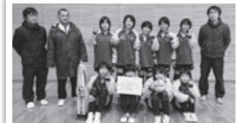
◀ 維和中 女子の部