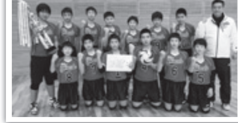
◀ 姫戸中 男子の部

2月15日、松島総合センター「アロマ」などで第32回上島地区中学生バレーボール上天草大会が開催されました。1・2年生で編成された男女合わせて18チームが参加。予選リーグ・決勝トーナメントを行い、男子は姫戸中学校、女子は維和中学校が優勝しました。この大会をきっかけにして、これからも頑張ってもらいたいです。なお、大会結果は次のとおりです。