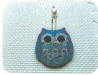
4月から新しく始めます