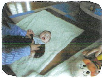
親子ふれあいポディートーク ふんわりタッチの様子です

寒さも随分やわらぎ春の訪れを感じ始めました。 4月から保育園に就園されるご家庭も多いかと思えます。 新しい生活の準備で忙しい月でもありますが時々ほっくり 休んで下さい。ぜひ遊びに来てください。