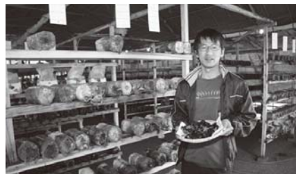
▲井上ファームリーダー

た。市長をはじめ職員の迅速な対応と誠意ある行動でした。さまざまな土地や建物を紹介いただき、キクラゲ栽培・加工施設経営を実行に移したいと考えるに至りました。