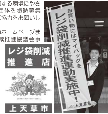
▲このステッカーとのぼり旗が目印

詳しくは、市ホームページまたはレジ袋削減推進協議会事務局(環境衛生課) ☎0964(56)1111までお尋ねください。