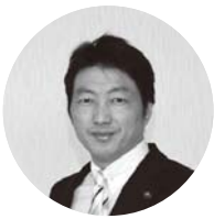
上天草市長 川端 祐樹

このたびの企業進出については、心から感謝申し上げますとともに、天草きのごファーム様の今後の事業展開に大いに期待しています。