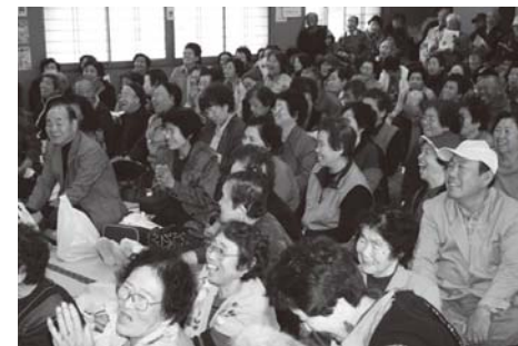
▲舞台上声援を送る参加者の皆さん

この活動をとおり、高齢者同士がふれあいを深め、近隣との助け合いを広げていきたいと考えています。