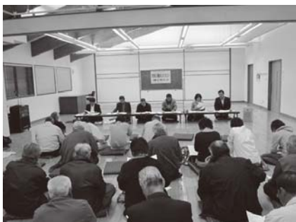
▲議会報告会の様子

平成23年 年頭 謹 新年 喜 申上 。昨年 市民 皆様 市議会 対 温 支援 協力 賜 上天草市 誕生 年 過 市民 皆様 自治体 実感 着 一方、少子高齢化 進行 人口減 少、地域経済 悪化、多 課 題 存在 事実、 対策 必 要性 同時 強 感、 急 速 変化 時代、 街 地 域 特性 生 活力 対 強 求 今一度 確認、 機 動 化 市民 役 割 一 目 指 思 力 背 負 今 度 確 認、 機 動 化 市民 役 割 一 目 指 思 行 錯 誤 年 本 市 議 会 開 催 議 会 報 告 会 開 催