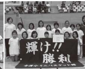
▲混成の部優勝 今津BBC (B)