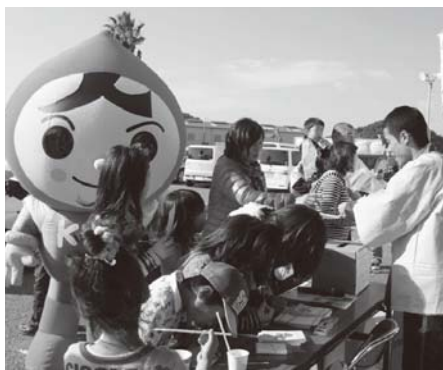
▲メッセージを記入する子どもたち

これは12月4日～10日の人権週間に合わせて行われたものです。この日は、人権イメージキャラクターの人KENももる君も登場。「みんなで築こう人権の世紀～考えよう相手の気持ち 育てよう 思いやりの心～」をキャッチフレーズに掲げ、人権擁護委員が「人権週間にきっかけに人権について考える機会にしましょう」と呼びかけながら、チラシなどを配りました。また、人権メッセージ「あなたの一ひとこと」を募集。訪れた人たちが足を止め、メッセージカードにそれぞれの思いを記していました。