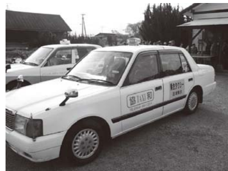
▲小瀬戸公民館での出発式の様子