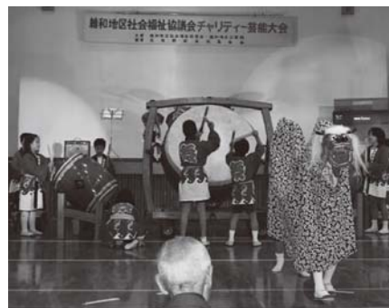
▲維和小3、4年生による「千束雨乞いドラ太鼓」