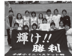
▲代表の部優勝 今津BBC

審判長より、「他の小学校は今津小学校を目標に、今津小学校は県で上位を目標に練習に励んでください」と講評があり、選手は元気よく返事をしていました。