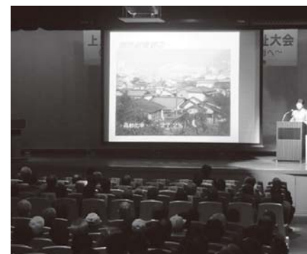
▲小地域ネットワークの事例発表の様子

市社会福祉協議会および市では、「向う三軒両隣」の支え合いの仕組みづくりとして小地域ネットワーク構築を進めていますので、これからも市民の皆さまのご理解とご協力をよろしくお願いいたします。