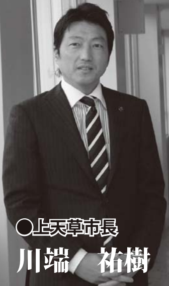
○上天草市長 川端 祐樹