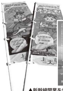
▲新幹線開業を告げるのぼり旗と大阪梅田駅に掲載予定の広告