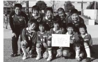
▲Eリーグ優勝 姫戸小A (上) Sリーグ優勝 姫戸小B