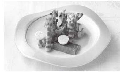
▲絹さやと車海老のサラダ

上天草市が誇る豊富な食材（魚、肉、野菜、果物など）を網羅した「食材パンフレット」（上天草食材美味図鑑）が間もなく出来上がります。市内特産の48品目の食材について、素材だけではなく、一流の料理人による調理例を前面に出し、「上天草市の素材はこんなに美味しいので