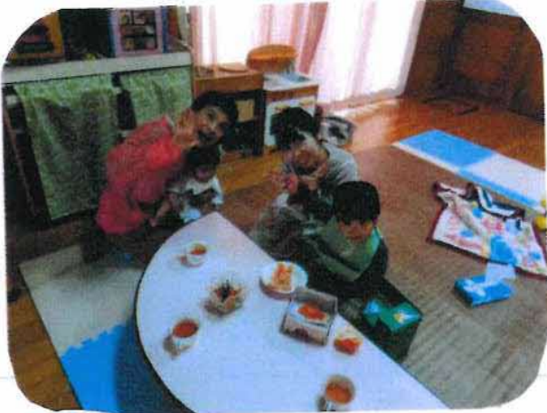
ふんわりタッチ終了後 リラックスタイムでお茶を しました