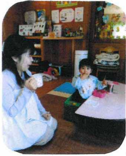
お弁当を持参され いつも完食です。 ママもお茶で一息

今年も早いもので残すところあと1ヶ月となりました。 みんなのいえをご利用いただきありがとうございます。 みんなのいえは大人も子供もたれでも利用できます。 どうぞ気軽にお願いいたします。