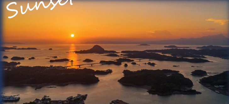
高舞登山からの夕陽

専用ハッシュタグ「#上天草の空見表」をつけて場所や日時など観察記録の情報共有をしよう。