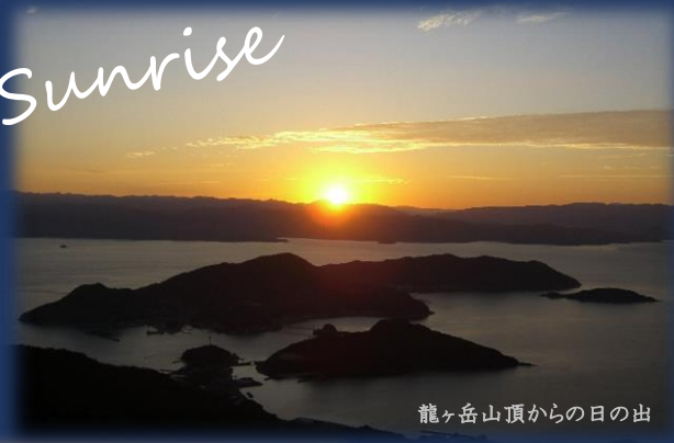
龍ヶ岳山頂からの日の出