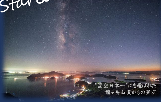
“星空日本一”にも選ばれた龍ヶ岳山頂からの星空