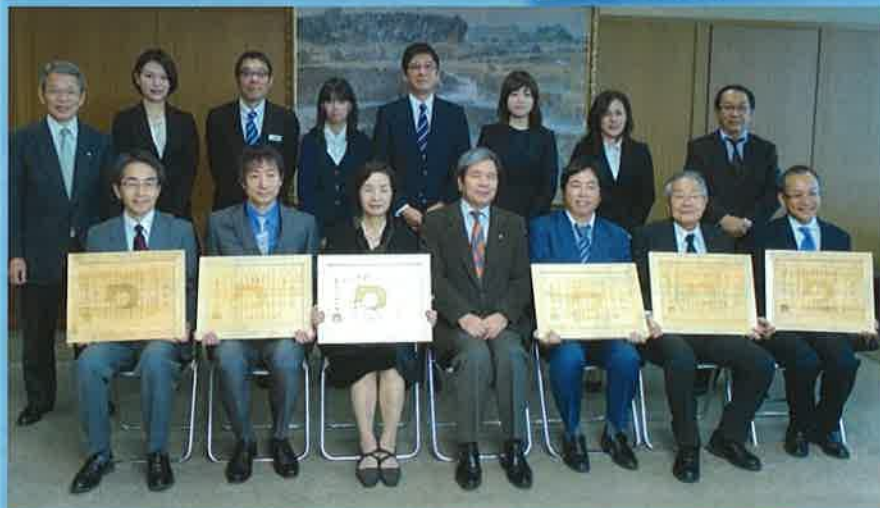
【写真左から】株式会社 日本政策金融公庫 熊本支店・八代支店／社会福祉法人 岳寿会 梅香苑・ひめゆり／医療法人 杏和会 城南病院／蒲島熊本県知事／株式会社 エスケーホーム／医療法人 信岡会 菊池中央病院／イオン九州株式会社 イオン熊本店

男女共同参画は、県政を進めていくうえで欠かせないものです。男女がともに働きやすい職場づくりを進めることは時代の要請でもあります。今後も、県内の男女共同参画のモデル事業者として、先導的な役割を果たしてくださると期待しています。【蒲島知事コメントより】