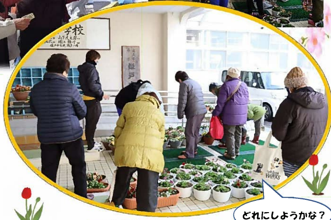
どれにしようかな？

地域の方との 入念な 打ち合わせ！ 試行錯誤を繰り返し、 又12月予定が天候不良により 延期となるも、 不安をよそに 大盛況！