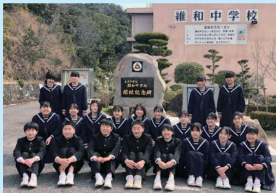
▲維和中学校閉校式の様子