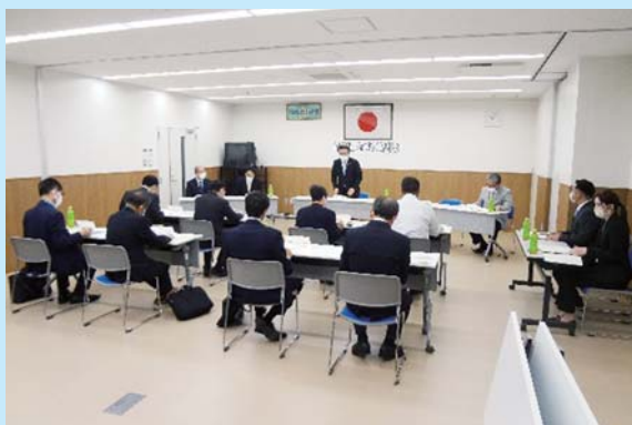
▲上天草市防犯協会評議員会（総会）の様子