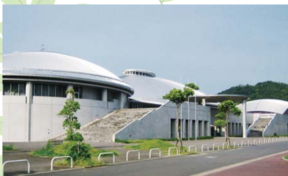
▲松島総合センター「アロマ」

市道における排水施設の破損、路肩の崩壊等、様々な課題に対応するため、道路の除草や修繕、道路整備工事や補修工事を実施するもの。