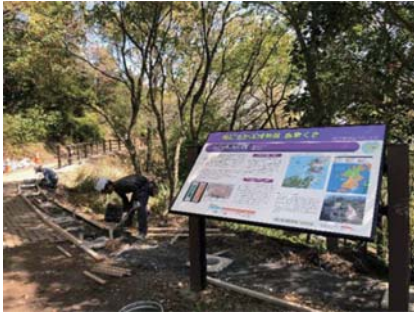
▲カントリーパーク花海好

答 今年度の大雨等により他の箇所においても落石等確認されたため、再度調査をしたところ、施工面積が広範囲におよぶことが判明し補正が必要になりました。