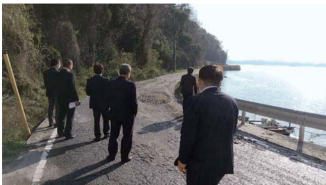
▲現地踏査の様子（経済建設常任委員会）

意見 現地を確認し、車が2〜3台通るだけでも粉塵が舞う状況にあり、環境・衛生面の観点から見ると、整備を行ったほうが良いと考える。