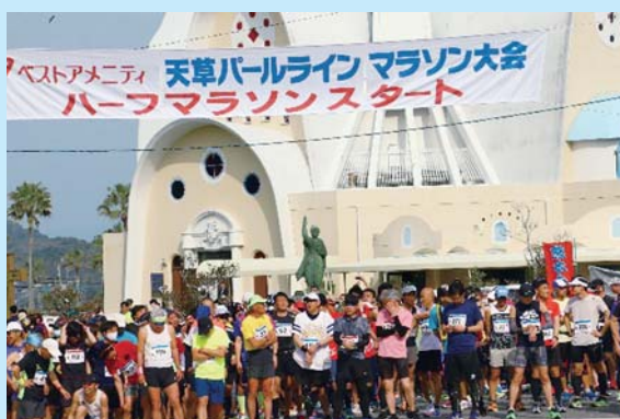
▲天草パールラインマラソン大会の様子