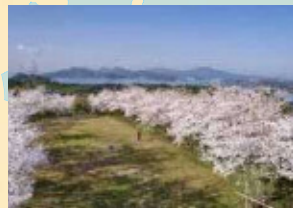
維和桜・花公園 園内には桜や水仙が咲きオルレに彩りを添える。5月・10月にはアサギダマの乱舞も見られる。