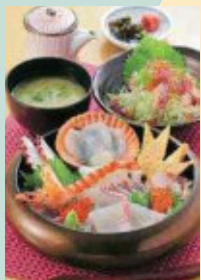
旬の活魚を豪快に盛った海鮮丼(上天草市内各所)