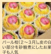
パール柑(2~3月)。皮の白い部分を砂糖煮にしたお菓子も人気