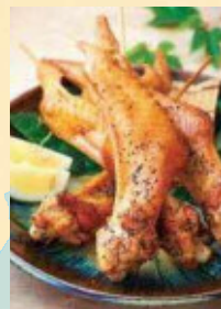
まぼろしの地鶏といわれる天草大王(上天草市内各所)