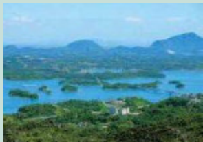
千蔵山 頂上からは上天草の山々や遠く雲仙を望む。