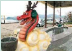
龍の足湯 池島の龍伝説にあやかって命名された。