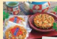
歯ごたえがやみつきに! 磯香る手焼きせんべい「天草大漁焼」 松島の唐辛子「まいったか!朱次郎」