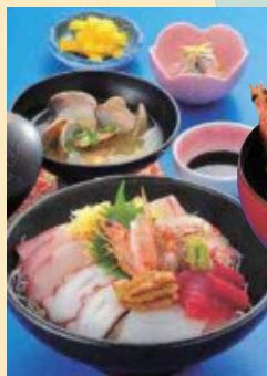
車海老天丼 海鮮丼 (上天草市内各所)