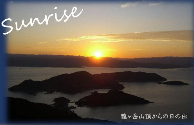
龍ヶ岳山頂からの日の出