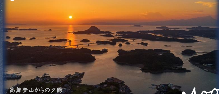
高舞登山からの夕陽

専用ハッシュタグ「#上天草の空見表」をつけて場所や日時など観察記録の情報共有をしよう。