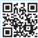
高橋 健 議員