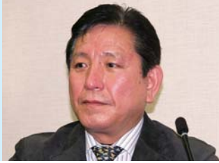
塩田 真一 議員