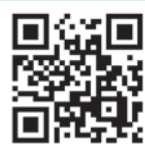
北垣 洋 議員