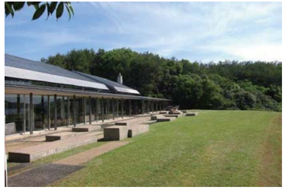
▲上天草市松島展望休憩所