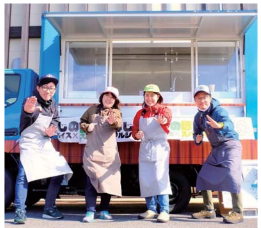
▲地域おこし協力隊の活動

経済建設常任委員会では、12月9日（金）に市役所大矢野庁舎において地域おこし協力隊を含む本市へ移住された方々と「起業・創業・就業等の支援について」をテーマに議会報告会を開催しました。参加者からは「起業するためのノウハウがなく、自分で何かを起こす最初のハードルがすごく高い。地域との関係づくりでは、地域の皆さんとの関係性やつながりなど仕組みを理解することに苦労した。」等の意見がありました。また、今後必要と考える取組や支援については、「起業や創業に当たっての講習会や学習会の開催。様々な問題を解決するために、上天草市の「人・モノ・仕事」の情報をシェアし、マッチングを図るなど、足りない部分を補い合える新たなシステムを構築したらどうか。」「事業者や移住者との定期的な情報交換の場を設けてほしい。」等の意見がありました。委員会としては、本市で起業や創業、新規就業等を目指す方々が活動しやすい環境を整えられるよう、継続した協議を行うこととしています。