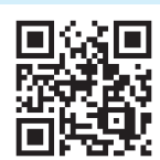
宮下 昌子 議員