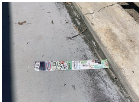
▲外平海岸のごみの現状