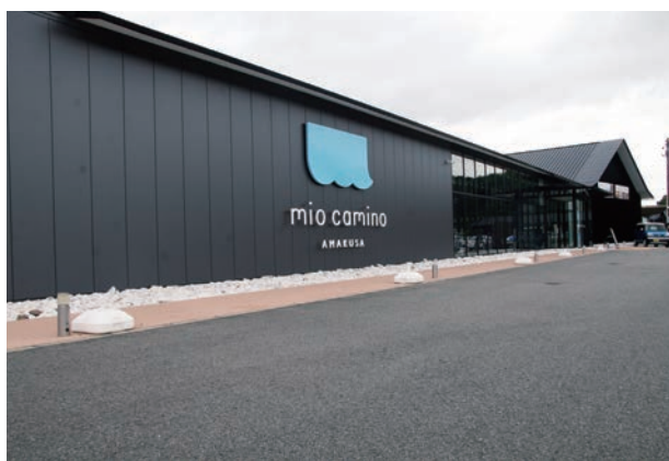
▲ミオ・カミーノ天草

が主であり、そこで、今後コロナの影響があれば、各年度で検討していくことと協議を行っていたところです。今回の令和3年度分については、収益が赤字の報告であったことから、補填することについて市で検討した結果で、また、令和3年度中に指定管理者が行った減収対策としては、独自の集客イベント等を実施するなど、収入増のための取組が行われています。これにより、令和3年度の入館者数は前年度と比較し、1万6千人ほど増加しており、実質の売上も若干であるが、伸びていることから、経営努力はあったものと評価しています。