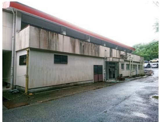
▲上小学校屋内運動場