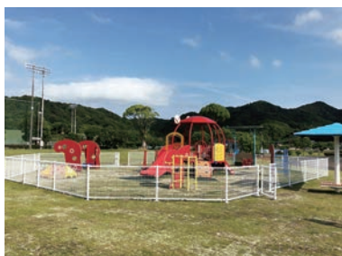
▲アロマの子ども広場遊具

市長 やれることを教育委員会のほうで検討してもらいうちに指示したいと思えますので、ご理解いただきたいと思います。