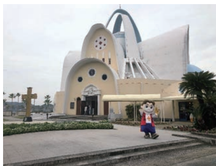
▲天草四郎ミュージアム

で取り組んでいるところです。 市長 開館以来20数年経って、当時からするとずいぶん減っています。映像コンテンツの改修などしましたが、何か企画展をやっていないかという関心度は高まらないかと思っています。今は、デジタル化が進んで、スマホやタブレットなどで使った情報提供や遊びなどすれば、又違った関心度が出てくるのではないかと原課に提案しています。 宮下 宿泊キャンペーンやイベントをしても入館者は増えない。それはミュージアム自体に魅力がないからだ。コンサートや専門講師による勉強会、歴史体験会など魅力をどう作っていくのかということを考えないと入館者は増えない。