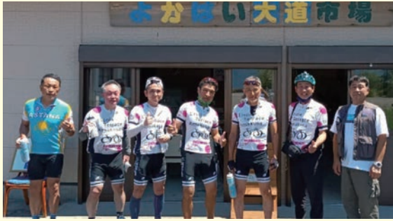
▲あまいちサイクリングクラブのメンバー

龍ヶ岳町の大道港にサイクルステーションの要素を兼ねたカフェ (café Bleu) がオープンしました。地元食材を使用した料理は、工夫を凝らしてあり、どれも美味。地域の活性で天草東海岸のサイクルツーリズムが盛り上がること間違いなしです。