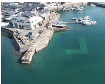
▲上天草港(江樋戸港区)

答 漁業者は27名と把握し、また、係留船舶は湯島定期船離発着所前の係留施設を含め62隻を見込み、今回工事を行う箇所については、18隻の係留船舶を計画しています。