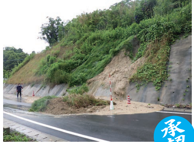
▲古野賤の女線の被災状況

令和4年6月20日から21日にかけての梅雨前線豪雨（24時間雨量93mm・時間最大雨量24mm：大矢野）により市道が被災したため、市道の崩土撤去等を実施するもの。