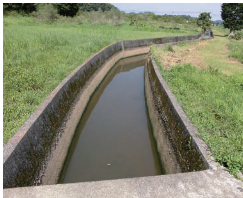
▲中南小学校横水路

答 大矢野川の賤の女新地、大矢野デイスカウトドラッグコスモス前の水路、シヨッピングプラザキャモン横の水路、登立山下地区消防倉庫前の水路、中南小学校横水路の計5箇所です。