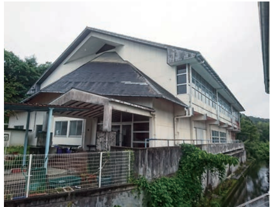
▲中北小学校屋内運動場