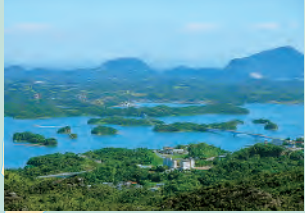
센간잔(산) 산 정상에서 가미아마쿠사 산과 운젠을 한눈에 볼 수 있다.

마츠시마 지방의 웅장한 3대 절경에 절로 매료되는 올레길 전원풍광을 거쳐, 거대한 바위 산을 향해 걸으면, 기독교인「아마쿠사 시로」 전설이 깃든 지역과 함께, '류노 아시유(龍の足湯)'에서 족욕을 즐길 수 있다.