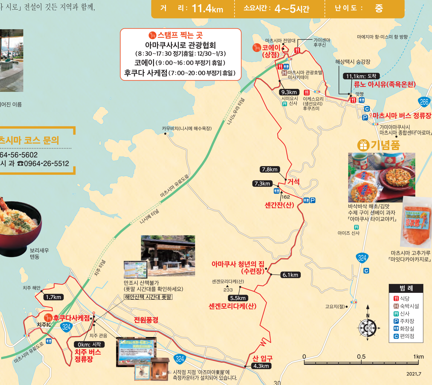
마츠시마 고추가루 「맛다카야카지리」