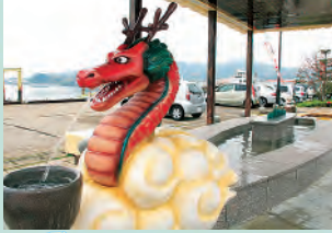
류노 아시유(족욕온천) 이케시마의 용의 전설을 따라 지어진 이름