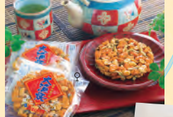
바삭바삭 해초/김맛 수제 구이 센베이 과자 「아마쿠사 타이교야키」