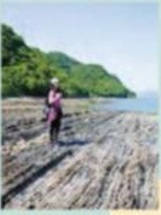
호카부리 자연해안 8500년전 지층이 드러난 다이내믹한 지형

기독교인「아마쿠사 시로」가 탄생한 섬을 순례하는 올레길 산 경상에서 바라보는 아소-운젠, 아마쿠사 제도의 풍경이 시간의 흐름을 잊게 해 준다.