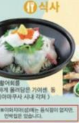
제철 활어회를 풍성하게 올려담은 가이센 등 (가미야마쿠사 산과물) 미치노에키 「가미야마쿠사 산과물」 가미야마쿠사 산과물 미치노에키 「가미야마쿠사 산과물」

가미야마쿠사 특산물 보리새우 미치노에키 「가미야마쿠사 산과물」 가미야마쿠사 산과물 미치노에키 「가미야마쿠사 산과물」 가미야마쿠사 산과물 미치노에키 「가미야마쿠사 산과물」