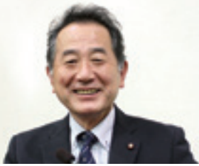
新宅 靖司 議員