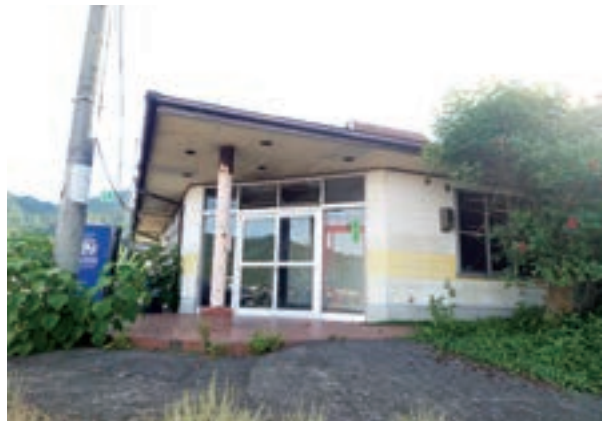
▲龍ヶ岳町大道港ターミナルビル

問 ハザードマップ作成業務委託料4529万4千円について、業者選定は、どのような基準で行うのか。