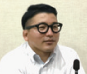
北垣 洋 議員

経済振興部長 農地利用状況調査で所有者に意向調査をもとに、合津地区人・農地プランを作成し、担い手への農地の集積、集約等に向け取り組み、耕作放棄地解消につなげていきたい。