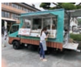
▲キッチンカーの様子

答 当初においては、8ナンバーを想定し計上していました。2年維持した場合の租税や保険料など2台で56万円程度の差額となります。ナンバーの登録は、運輸支局の判断でございまして、実際の車両を確認し判断されるものと伺っております。