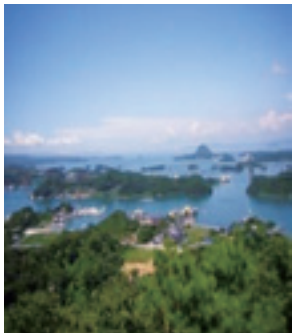
▲高舞登山からの眺望

市長 海運組合を通じ、各船主にワクチン接種の開設状況等の情報をお渡ししています。 健康福祉部長 住所地以外でも接種ができる住所地以外接種というのがあります。この手続きの方法についても、組合の方にお知らせしたところで。