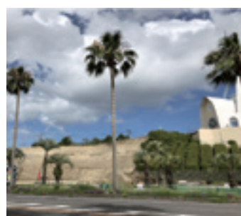
▲建設予定地「四郎公園」