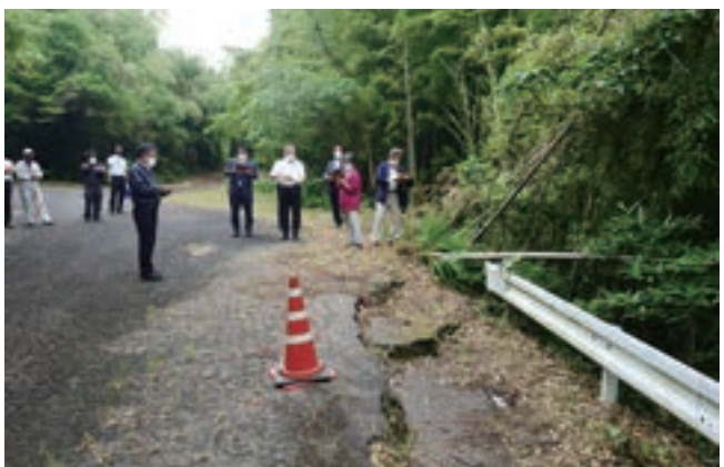
▲教良木野々川地区災害現地踏査