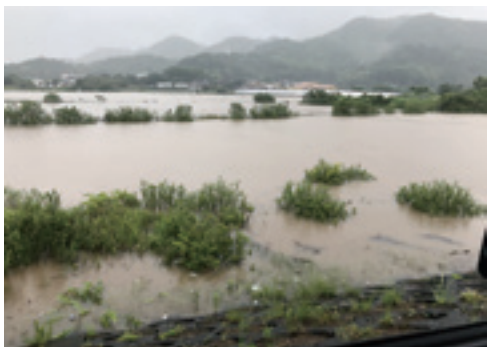
▲5月17日 維和大桜地区冠水状況

教育部長 公立図書館の任務と目標に掲げられる図書館シテム整備のための数値基準によると大矢野地区の図書館として必要な面積は1358㎡、蔵書規模が6万9千冊となります。今回の計画においては敷地の有効利用等を考慮し、面積を約680㎡、蔵書数については6万冊を計画しています。このことから、概ね本市の規模に相応した図書館になると認識しています。 教育長 県下14市の百人当たりの読書量の調査において、本市は今まで一番ビリでした。関係者の努力の甲斐もあり一つ上がったといった状況です。読書量と学力については比較して向上するという調査結果もあり、図書館に行ったら誰もが学べるといった機会を提供してやるのが肝要かと考えます。