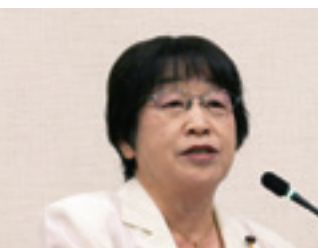
宮下 昌子 議員