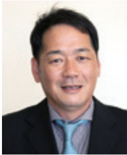
田中 万里 副議長