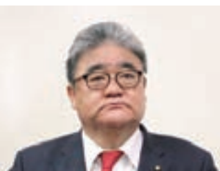
桑原 千知 議員