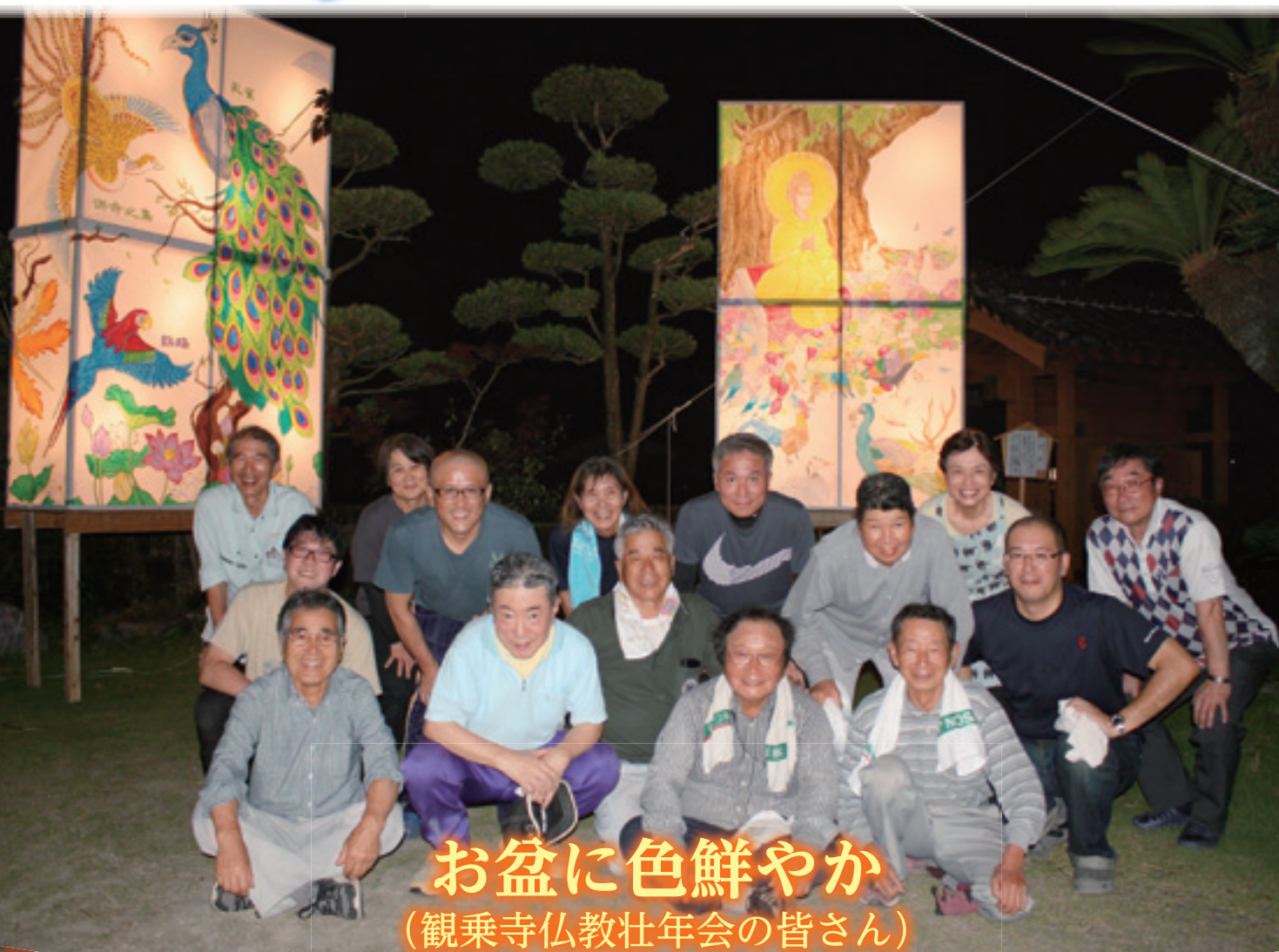
お盆に色鮮やか (観乗寺仏教壮年会の皆さん)