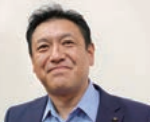
何川 雅彦 議員