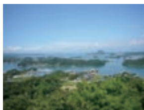
▲高舞登山からの眺望