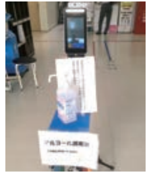
▲非接触型検温端末（宇土市）

何川 荒尾市では、昨年9月にRPA※をふるさと納税業務に導入した。12月までの3ヶ月間で約1万件を処理し、