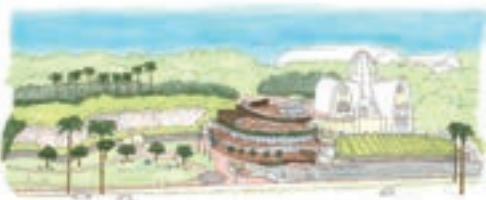
▲新大矢野図書館のイメージ図

副市長 図書館は市民の学びを支える場であると共に、交流するコミュニケーションの場を提供する所だと思います。図書の貸し出しだけでなく、