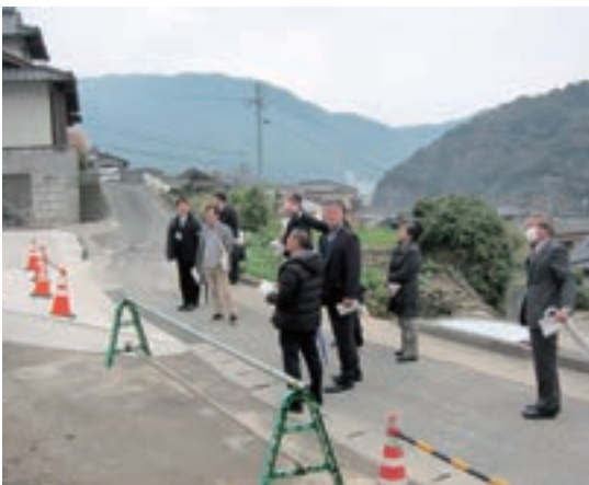
▲市道路線の認定箇所を確認

答 6月にフカ狩りを予定していたのだが、台風が接近し中止となり、その後地元の漁業者との日程調整がつかず、未実施となり減額しました。