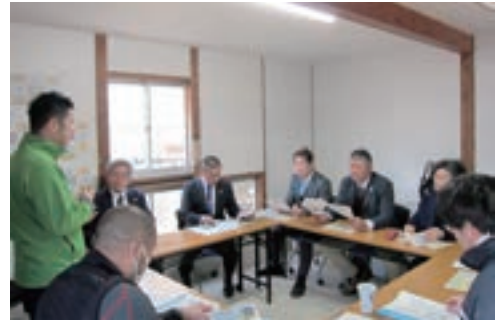
▲農家ハンターから獣害対策の話聞く委員

18日は、甲佐町が力を入れている空き家対策について話を聞きました。同町では空き家バンクとの連携や、空き家活用の勉強会を実施しており、古民家を活用した宿泊施設の整備も計画しています。