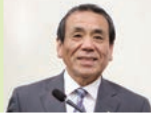
島田 光久 議員