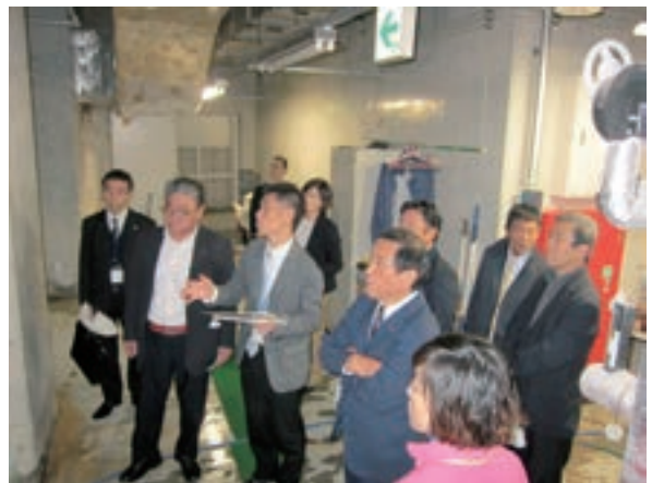
▲スパ・タラソ天草のボイラー室を調査する委員