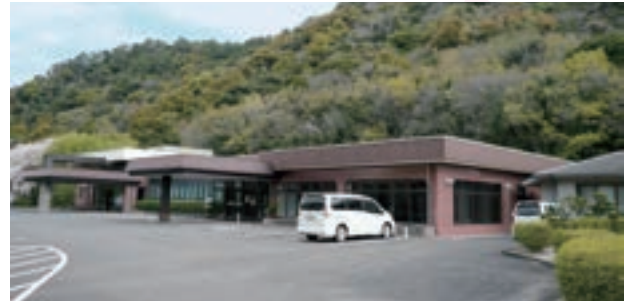
▲大規模改修を予定している斎場

火葬炉3基を含めた施設全体の大規模改修を行い、2038年まで20年間の施設の長寿命化を図る。