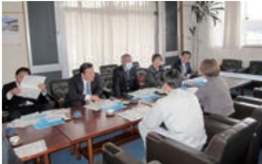
▲隠岐の島町役場職員から事例を聞く委員

総務常任委員会は1月23日から25日までの期間、島根県隠岐郡を訪問し、人口減少に伴う施設の有効活用や移住者受け入れの取り組みについて視察しました。