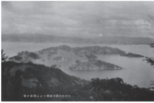
昭和31年国立公園指定を受け発行された絵ハガキ

市長 天草管内2市1町で長崎と天草地方の潜伏キリシタン関連遺産の世界遺産に向けての協議会を設置して、天草全域での世界遺産に向けてのPRと準備を進めてまいります。メモリアルホールも開館以来24年が経過し、来客数も減っており、展示品をもっと充実させ、来客者の増につなげていきたいと考えています。