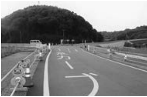
大矢野バイパスの交差点

何川 現在三角側から、大矢野町登立東満交差点まで工事が行われている。市道、東満、白涛線がバイパスにつながり、新しく交差点ができた。県の説明では信号機の設置は無いとのことだが、開通すれば車の通行も大変多くなり、危険な状態になると考える。信号機の設置について、県から市に説明はあったのか。