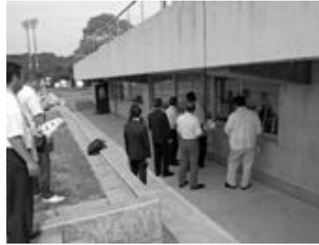
6月14日文教厚生常任委員会 現地踏査 松島町総合運動公園