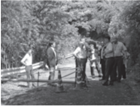
6月15日経済建設常任委員会 現地踏査 教良木野々川地区 地すべり現場

答 全て買い取った場合の金額についてはこれからの交渉でありますので未定です。また、300点程の収蔵品となるので、今の展示スペースを一部改修してローテーションで展示したいと思いません。