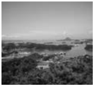
高舞登山からの眺望