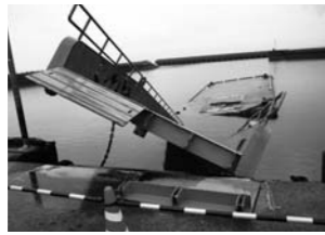
▲被害のあった永目港

総務企画部長 9月2日に九州電力と協議をさせていただきました。保安上問題がある場合、所有者確認をした上で伐採しており、そういうところがあればご連絡下さいとのことでした。