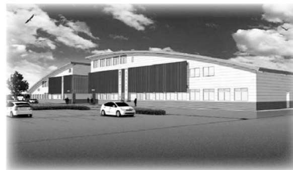
▲松島庁舎兼保健センター完成予想図▶