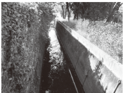
▲EMを使ってきれいになった川(中南小学校外堀)