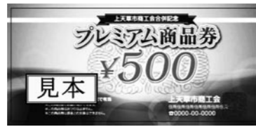
▲プレミアム商品券 (見本)