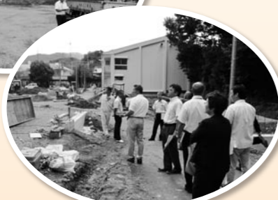
▲渡り廊下建設予定地