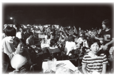
▲姫戸の夏祭りの様子

大変厳しい発言です。申請・報告を受け、市補助金交付規則に基づき所管部署において審査の上、交付しています。厳しい財政の中、限られた財源の有効活用を図って参りたいと考えています。