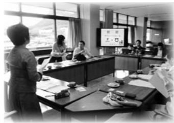
▲武雄市との意見交換の様子