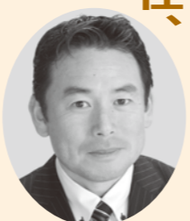
高橋 健 議員

高橋 今年の10月25日に県立劇場で県内の居酒屋さん88店舗が参加するイベントがある。次年度このイベントを活用して、上天草市の食材を使ったメニューを開発していただき、その中からグランプリメニューを選出する。当然、依頼するには費用が必要になってくるが、メニュー開発までには参加店舗が上天草市の食材を発注するだろうし、居酒屋さんのオーナー達は本気で売れる商品を開発するだろうから、イベント後も自分のお店で出してくれる。年間を通して参加店舗の食材発注額をブランド推進室が把握すれば、費用対効果もきちんと打ち出す事が出来る。