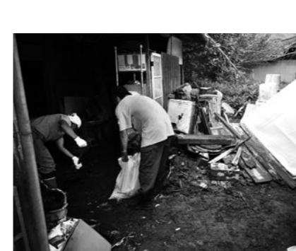
▲九州北部豪雨におけるボランティア活動

田中 上天草管内で九州北部豪雨のような大雨等が発生した場合、冠水する箇所は把握してあるか。 総務企画部長 梅雨時期に冠水した箇所が、国道では大矢野の江後地区、寺尾地区、松島の阿村地区から姫戸の牟田地区までにかけての国道3力所。県道では大矢野の越の浦地区と松島の今泉地区、知十地区。市道では大矢野の新田、船江、四郎丸、寄船、荒木浜、柳、亀の迫、小瀬戸、維和の7区と13区、松島の今村、馬建、龍ヶ岳の葛崎で13力所。他に近年冠水が報告されている地域が大矢野の岩谷、野米、貝場、千束、松島の西目、姫戸の二間戸と海岸に面したところで冠水の報告がなされています。