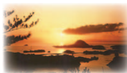
▲高舞登山から望む景色