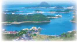
▲高舞登山から望む景色

高舞登山(標高117m)…国指定、名勝指定、指定年月日:昭和10年6月7日 場所:上天草市松島町阿村