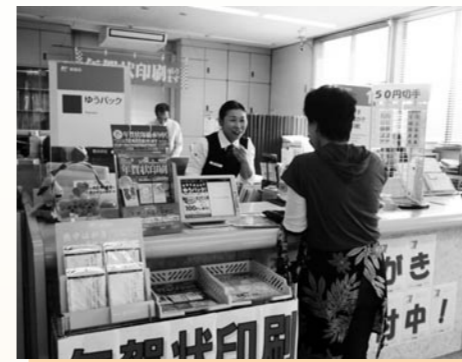
▲大矢野町柳郵便局 (来年4月から窓口5業務を受託する11カ所のうちの1つ)

郵便局に委託した場合、個人情報情報の漏れが心配。契約するにあたっては、厳しい罰則を付した条文(契約)を望む。