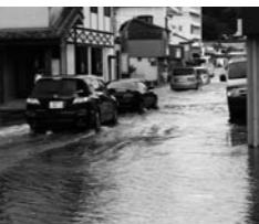
▲高潮被害(合津港付近)

教育部長 市内19校の耐震診断は終わっています。耐震化工事につきましては、本年度末には2校を残して終了し、来年度完了する予定です。