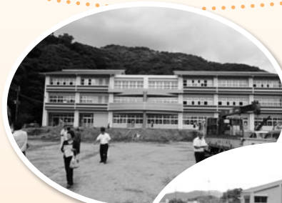
▲建設中の 龍ヶ岳小学校