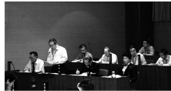
▲執行部による答弁の様子

教育部長 議会等、公式の場での発言には重大な責任があり、約束事については当然守らなければなりません。