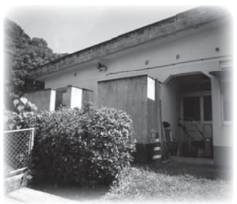
【改修か撤去の決断を!】 (姫戸町民グラウンドのトイレ)

教育部長 姫戸支所長とも相談し、地元の住民の意見も聞きながら、今後対応したいと考えています。