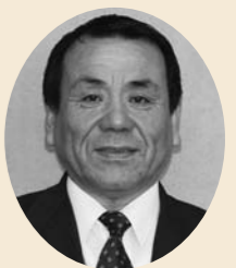
島田 光久 議員

島田 9月12日に倉江浄水場改築や龍ヶ岳小学校改築など、総額22億円ほどの工事入札が予定されている。新聞報道で、談合情報が寄せられているとのことだが、どのような情報なのか。