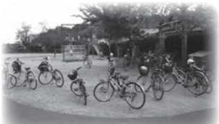
【グラウンドや駐車場の早急な整備を!】

窪田 通学道路も見通しが悪い箇所がある。児童や保護者の方々は安全安心な学校を期待している。統合して良かったという声が聞けるような教育環境の整備をお願いしたい。