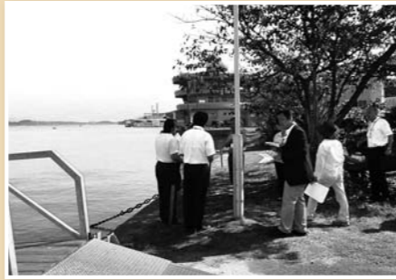
経済建設常任委員会は、前島地区の護岸を現地で調査