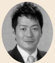
田中 万里 議員

田中 ソーシャル事業とは、社会的課題の分野として、福祉、教育、環境、まちづくりなどの公共の分野であること、具体的には高齢者、児童、女性、外国人、障がい者等へのサービスの提供、雇用の創出、環境づくりなどにかかわる活動のことです。この事業を、上天草市がモデル地区(自治体)になり、ビジネス化したらどうか。