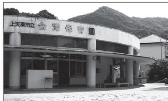
保育園跡地は子育て支援センターなどに活用される予定です。

少子化に伴い、公立保育所の適正化を図るため、平成24年4月1日に市立合津保育園を廃止するための条例改正。