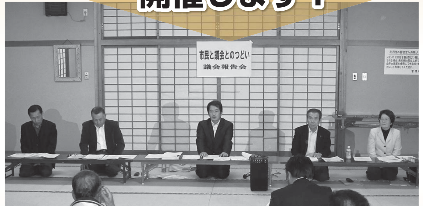
(昨年度の報告会の様子)

市民の皆さんからのご意見や提言をお聞きして、今後の議会活動に生かすため、報告会を開催します。お誘い合わせのうえ、ご参加ください。