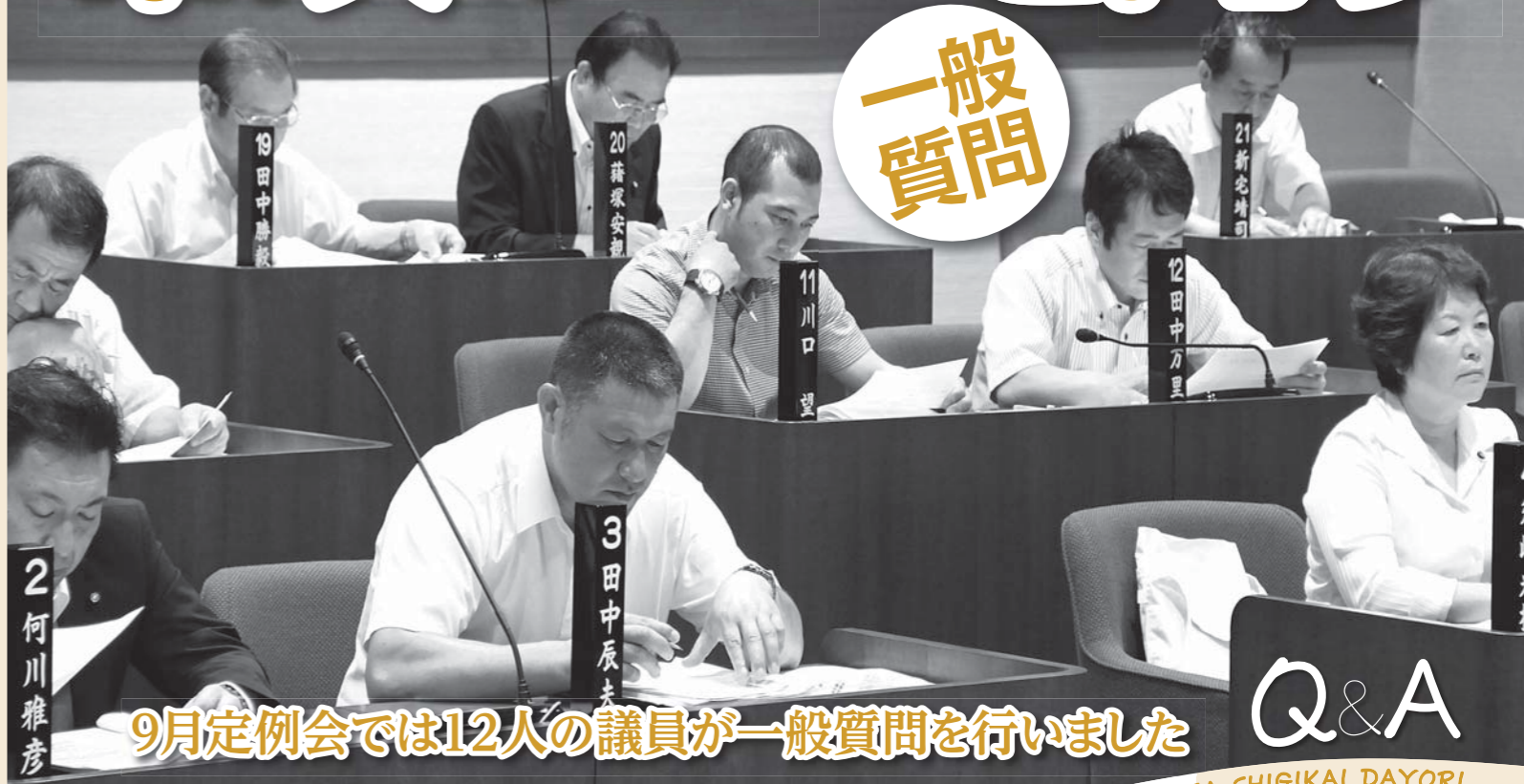
9月定例会では12人の議員が一般質問を行いました