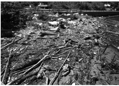
「漂着物回収に支援を!」

市民生活部長 熊本県では、海岸漂着物処理推進法により、海岸の管理者、ボランティアによる県下一斉の清掃や、漂着ポリ容器対策の一層の推進を図るために、各種事業を行って