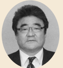
桑原 千知 議員

桑原 八代海に面している市全域の沿岸では、特に梅雨から台風シーズンには、巨大な樹木や雑木、ビニール、ペットボトル等で漂着物による被害が著しい。海の生物にとっても最悪な環境となる。観光の面からみてもマイナスイメージはまぬがれないと思うが。