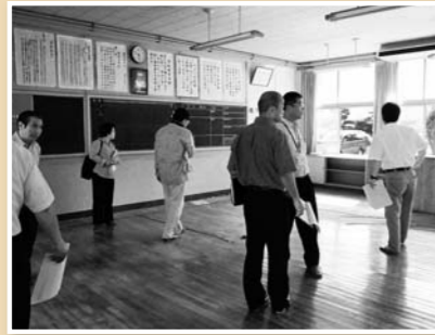
文教厚生常任委員会は、龍ヶ岳中学校校舎(高戸)の改修などについて現地で調査