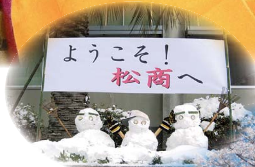
松島商業高校 松商バザール