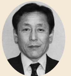
小西 涼司 議員