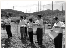
テニスコート建設予定地を視察

答 平成25年の県民体育祭上天草大会のテニスコートは、テニスだけの使用ではなく、キッズサッカーやフットサルでも使えるように計画しているため、観光や地域振興の面からも期待できる施設になると考えています。(社会教育課)