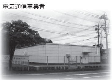
「光ファイバーの早期整備を!」

総務課長 基本的には、まずは電気通信事業者の責任のもとで整備することが原則です。国では2015年頃を目途に『光の道』を完成させ、地域の活性化を実現することが盛り込まれています。民間主導で環境整備が進まない状況下にあつては、国の交付金や起債を最大限に活用して、実現できるよう推進していきたいと思っています。