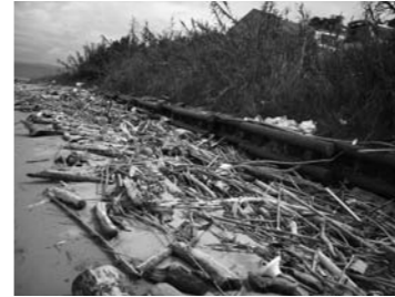
「大量の流木、活用できないか？」

北垣 海岸漂着物については、全国的に問題になっている。今年は例年に比べ、多くの流木が市内沿岸に漂着した。合併時の新市建設計画の中に「海の日の祭りの開催」との項目があるが、そのようなイベントで流木を活用した催しを行ったらどうか。総務企画部長 八代市、宇城市、氷川町および本市で設立された「八代海北部沿岸都市地域連携会議」において、そういう祭り等のイベントの提案をさせていただきたいと思っています。