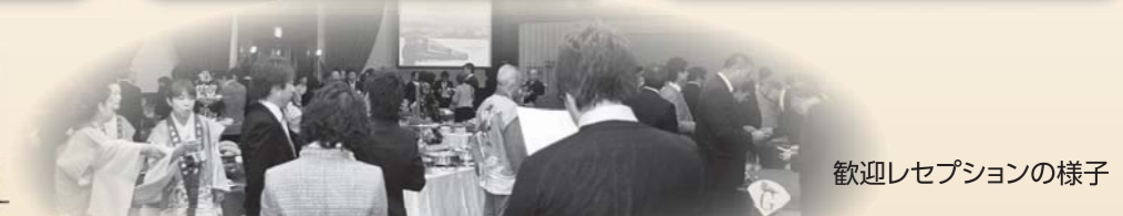
歓迎レセプションの様子