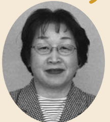
宮下 昌子 議員

宮下 姫戸〜八代間航路が休止になり利用者は困惑している。また、松島〜八代フェリーは、燃料の高騰などで赤字運営が続き、継続が厳しい状況です。市からの支援で航路を何とか守ってほしい。