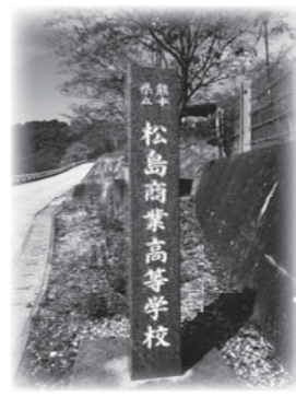
【跡地の有効活用を!】

教育長 指導者の養成、あるいは、著名な方などを招致して、技術の向上を図っていくことも重要かと考えています。