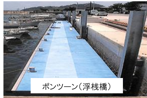
ポンツーン(浮棧橋)