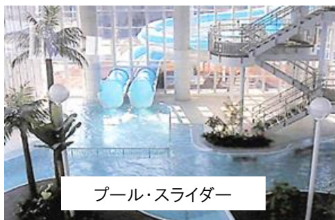
プール・スライダー