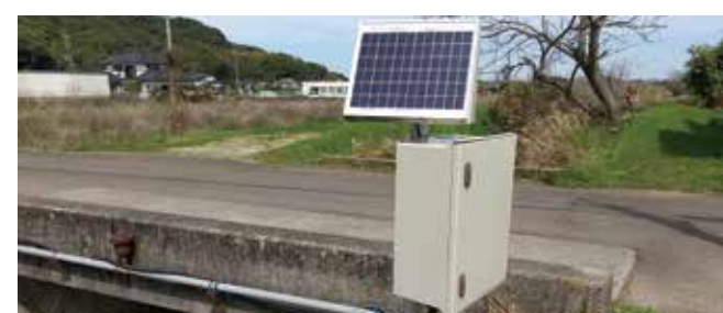
危機管理水位計(合津川)