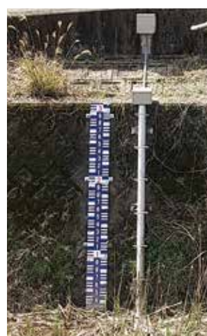
水位観測所(今泉川)