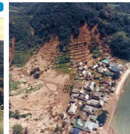
災害発生後の状況(龍ヶ岳町 高戸地区)