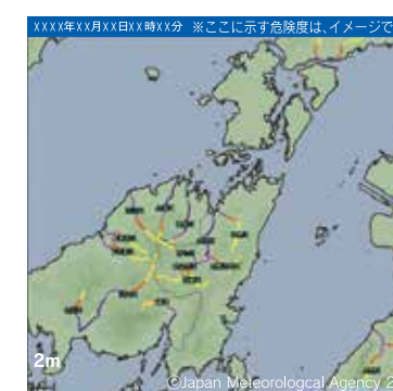
※気象庁ホームページより

中小河川の洪水災害発生危険度の高まりを、5段階に色分けして示す情報です。避難にかかる時間等を考慮して、3時間先までの予測値を用いており(10分ごとに更新)、洪水警報等が発表されたときに、どこで危険度が高まっているかを把握することができます。