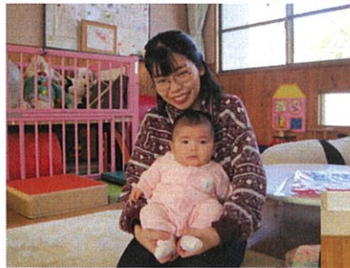
新しいお友達が遊びに来てくれました。