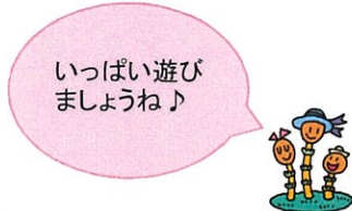
いっぱい遊びましょうね♪