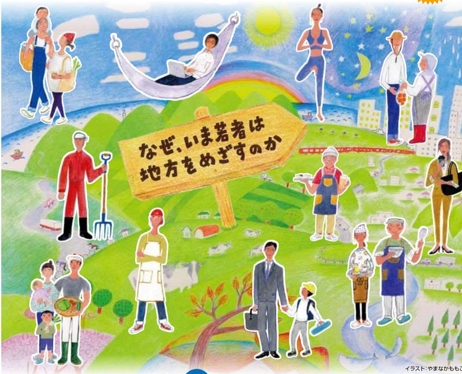
イラスト:やまなかかもこ