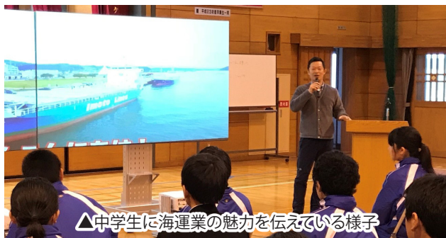
△中学生に海運業の魅力を伝えている様子