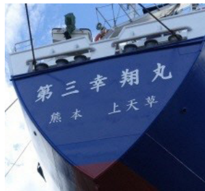
▲所有貨物船「第三幸翔丸」