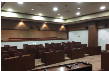
▲上天草市議場へ採用されました。