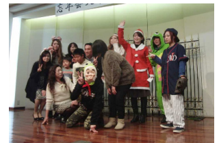
▲皆で楽しむ大忘年会