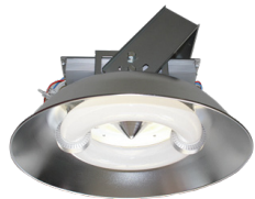
▲自社オリジナル商品のELIランプ