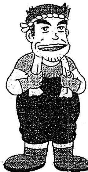
受入漁業者 (漁労長など)