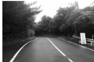
▲永浦～樋合線工事予定箇所