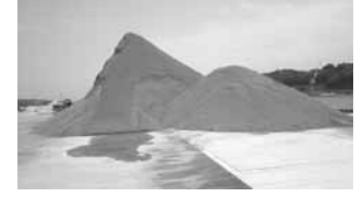
▲野積みされた鉄鋼スラグ

経済振興部長 県に具体的な施工計画の提示がなく、現状で被害想定はできません。環境調査については、法的義務付けはありませんが、鉄鋼スラグ協会内にガイドラインがあり、施工中、施工後において、強アルカリ水流流出対策、粉じん対策の調査・点検を行うことになっていきますし、調査結果の提示を求めることが可能です。施工にあたっては工事を行う者が責任を持ち、近隣住民、関係団体等へ十分な説明、同意を得た上で着手することが望ましいと考えます。