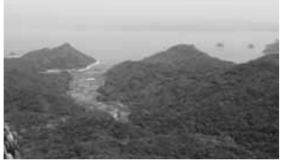
▲観海アルプスの念珠岳と烏帽子岳からの眺め

市長 重要な文化的景観としてなり得るかどうかが、法律的なものもあると思いますので、精査・検討して観光としてのメリットがあるということであれば考えていきたいと思