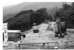
▲望薩峠の工事の様子

民主党政権では、県下の市町村の陳情・要望を民主党県連で受け付け、常任幹事会でA・B・C・Dのランク付けをして東京の幹事長室に届けるシステムでした。