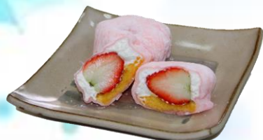
小さなケーキ屋さん mof-mof