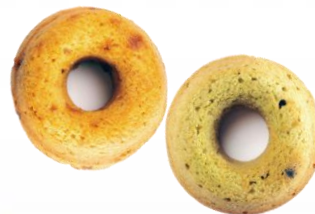
創作菓子工房 アローム