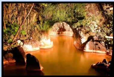
大洞窟の宿 湯楽亭