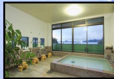
ひのしま荘 ※沸かし湯