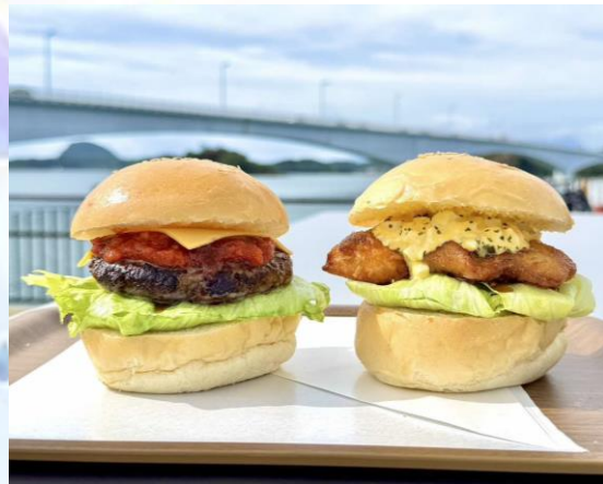
mio camino AMAKUSA