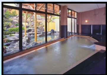
松島観光ホテル 岬亭