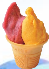
リゾラテラス天草