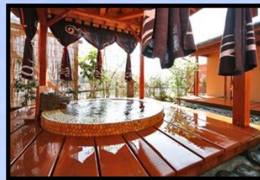
旅亭 (藍の岬) ※沸かし湯