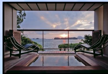
ホテル竜宮 ※家族湯のみ