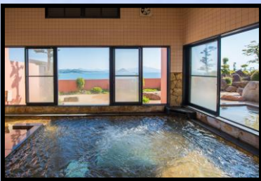
ホテル松竜園海星