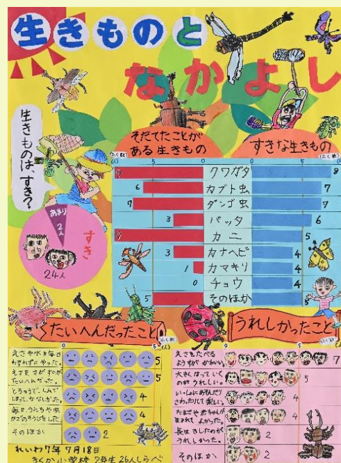
第73回 特別賞(全国コンクール佳作)