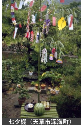
七夕棚 (天草市深海町)