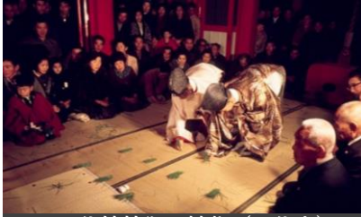
八代神社御田植祭 (八代市)