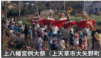
上八幡宮例大祭 (上天草市大矢野町)