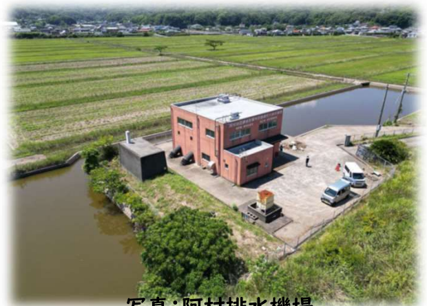
写真：阿村排水機場

熊本県と上天草市では、阿村排水機場の復旧工事を進めており、梅雨時期までに仮稼働を開始する予定としています。 仮稼働が始まりましたら、昨年度の被災前と同程度の排水能力(3.0m 3 /秒)を確保できる見込みです。