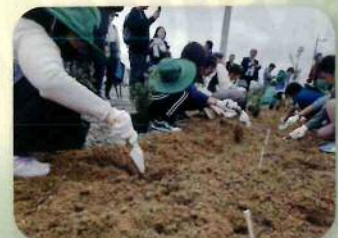
育樹活動(球磨地域)