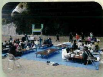
体験イベント(八代地域)