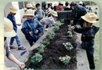
花苗の配付等(玉名地域)