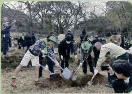
育樹活動(水俣芦北地域)