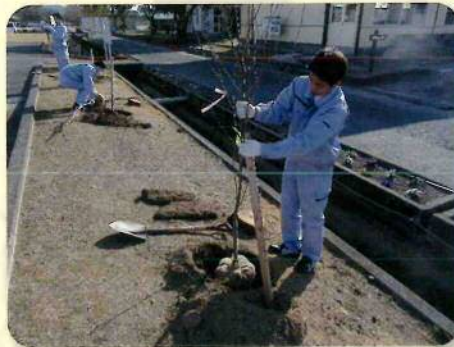
花木友の森(熊本地域)