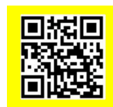
申込サイト QRコード