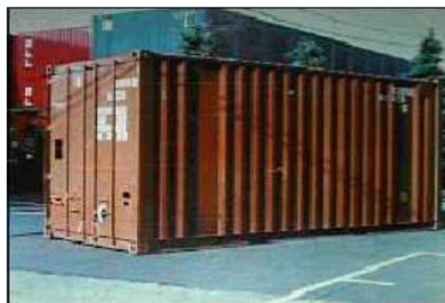
貨物用コンテナ (20フィートコンテナ) サイズ：高さ 2.591m, 幅 2.438m, 長さ 6.058m