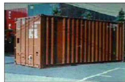
貨物用コンテナ（20フィートコンテナ） サイズ：高さ 2.591m、幅 2.438m、長さ 6.058m